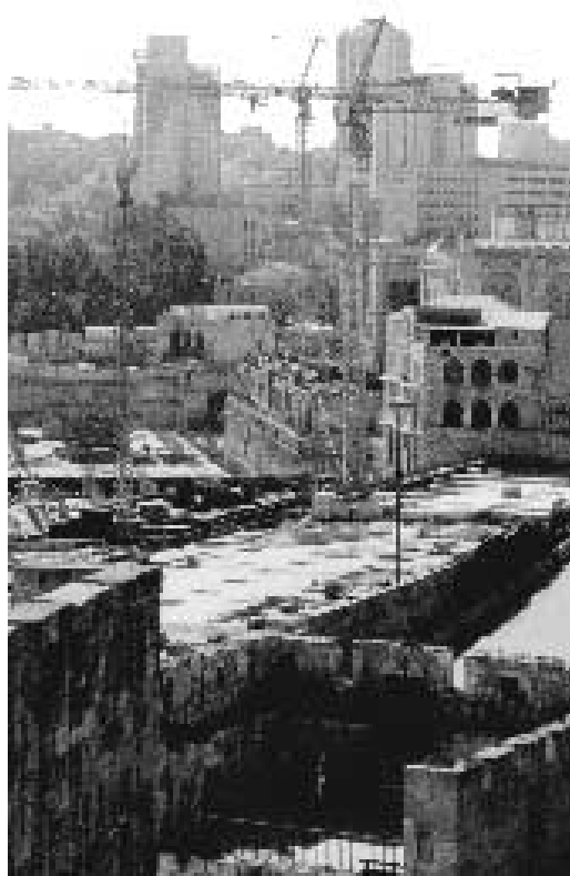
Eyal Hotel er en av skyskraperne i bakgrunnen.

Bet Norvegia. Hatzfira str. 26, Emek Rephaim. Jerusalem. Tel: 02-5638923.